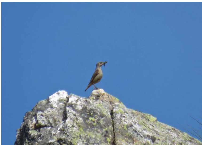
Codirossone con imbeccata – 22/07/2017 Alta Veddasca