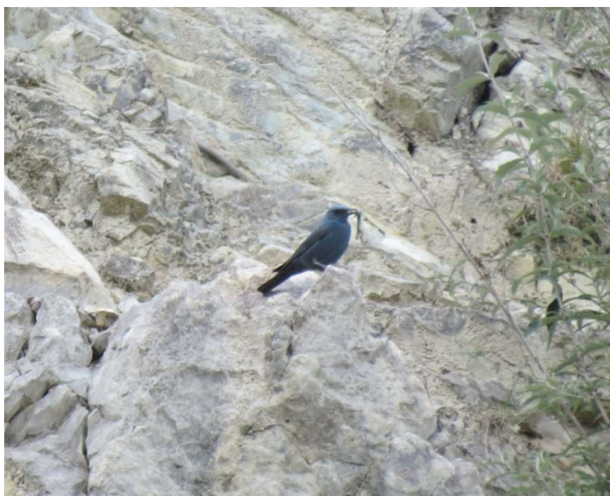
Passero solitario con imbeccata – Alta provincia 31/05/2014

Sempre in relazione al secolo attuale, l'attivazione nel 2009 del portale www.ornitho.it fornisce un fondamentale contributo alla raccolta dei dati faunistici: per la provincia di Varese risultano presenti nel periodo 2009-2017 oltre 400.000 dati, di cui circa il 7% di questi dati si riferisce a nidificazioni certe o probabili. A conferma di tali considerazioni ben 21 sono le specie presenti nel gruppo "F" (nidificazione non accertata nella ricerca "AOG 2003-2005" ma solo successivamente), tra queste alcune la cui precedente nidificazione documentata risale al secolo scorso (Es. Biancone , Codirossone , Passero solitario ) o altre la cui nidificazione è stata confermata per la prima volta in provincia di Varese solo recentemente (Es. Gufo reale anno 2016, Assiolo anno 2010).